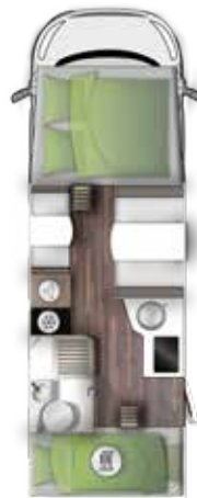
A 699 VB