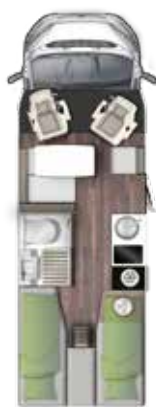
T 699 EB