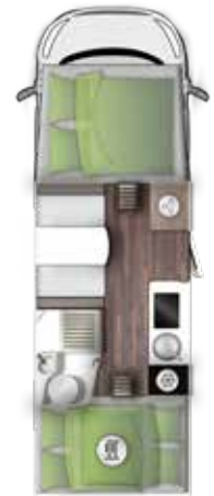
A 699 DVB