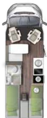
T 669 EB