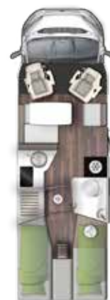
T 745 EB // TOP TEN