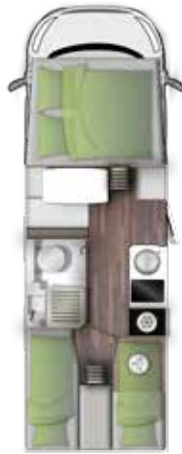
A 699 EB