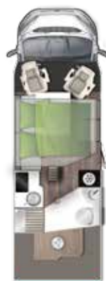
T 699 LF